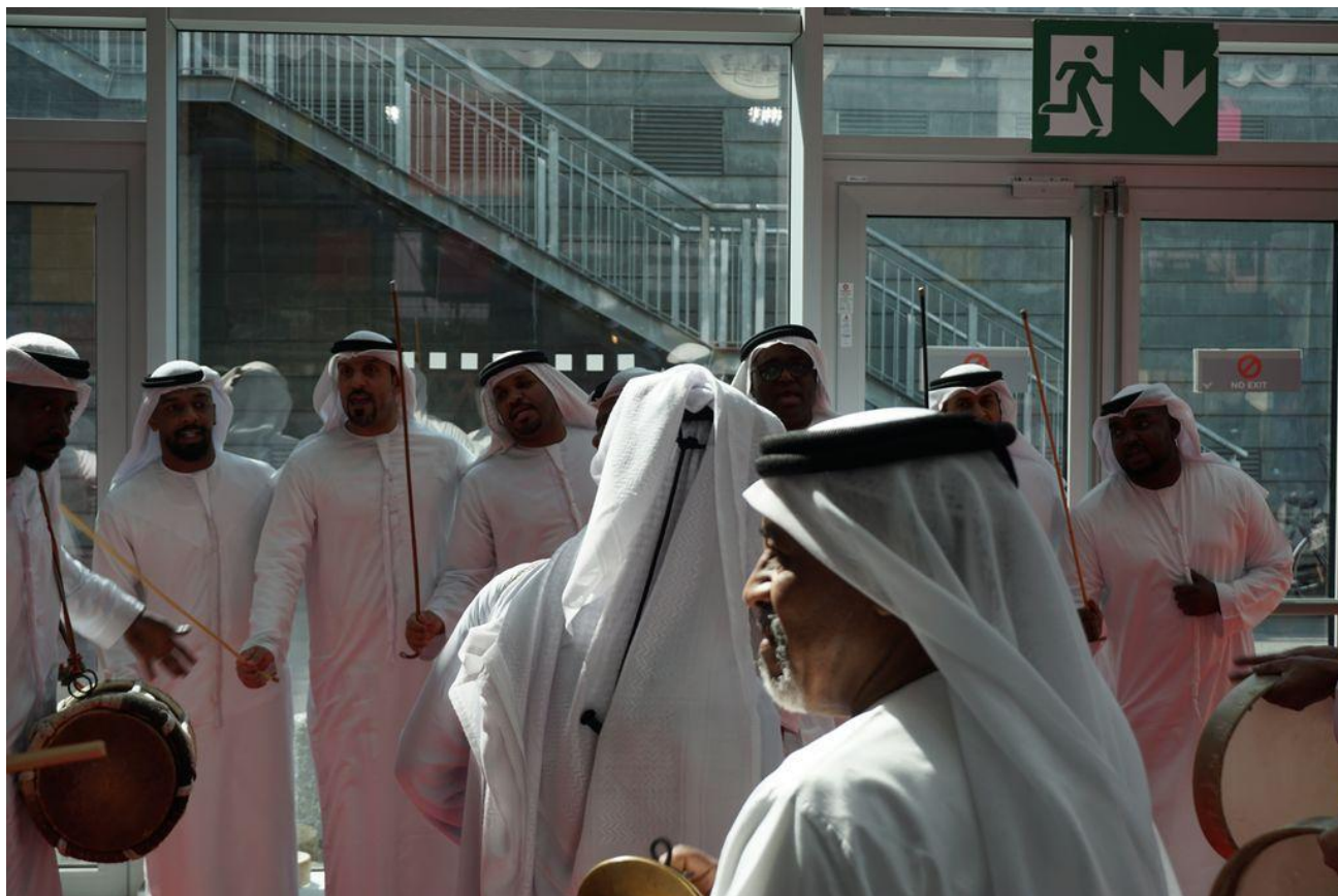
Sharjah National Band