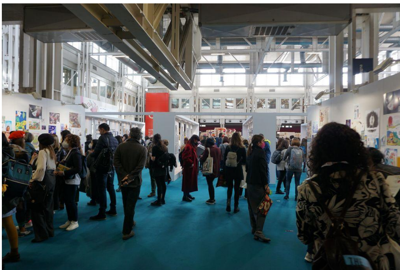
Bologna Children's Book Fair 2022